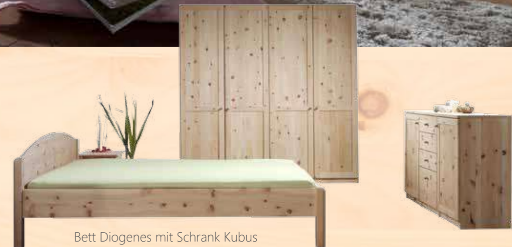
Bett Diogenes mit Schrank Kubus und Anrichte Jaso