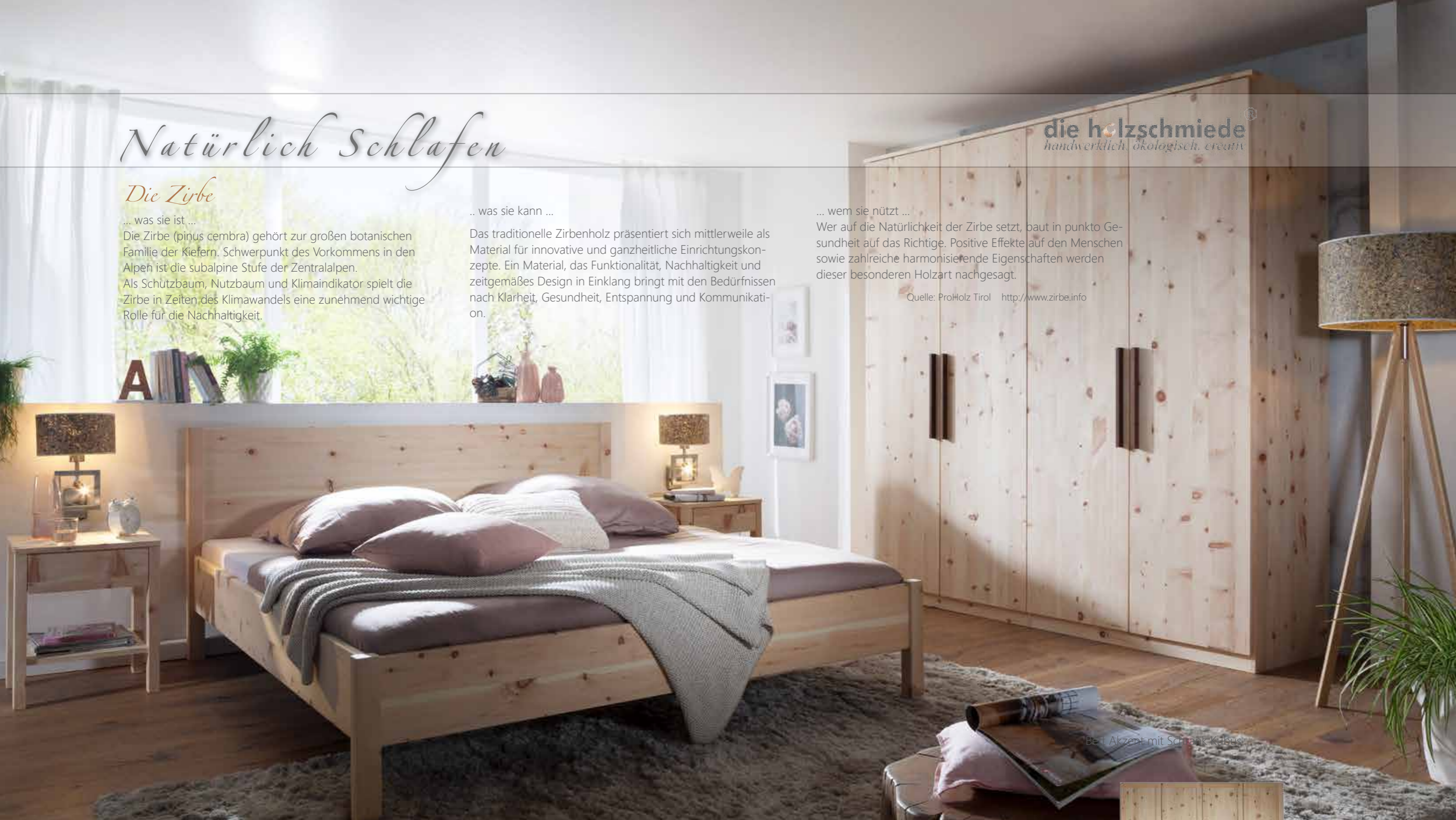
Bett Akzent mit Schrank Kubus