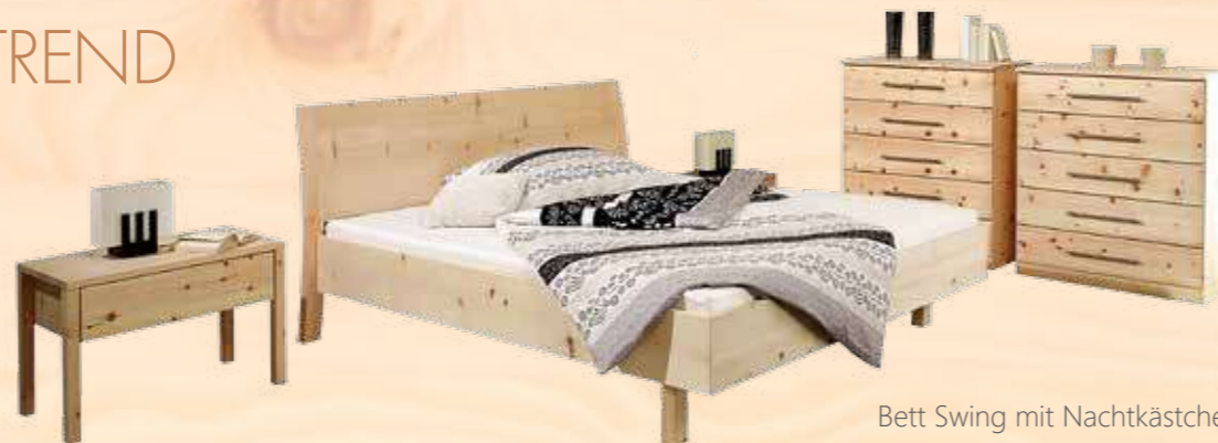
Bett Swing mit Nachtkästchen 3 und Anrichten Kubus

ein Weg vom Traditionsholz zum Holz der ganzheitlichen Wohnkonzepte